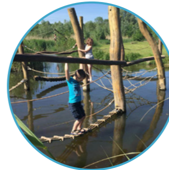
BELEVENISSENBOS Nummer 1

Het Belevenissenbos in Lelystad bestaat uit 40 hectare 'natuurlijk spelen'. Er zijn talloze speelplekken, kilometers aan routes en waterpartijen. Je kunt uren klimmen en je volop uitleven. Sommige routes lopen over het water wat het extra uitdagend maakt.