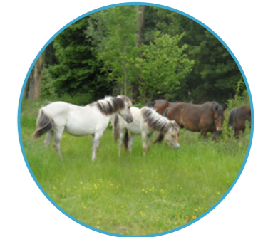
PAARDENVALLEI Nummer 3

De route loopt parallel aan de wandel- en fietsroutes van het Zuigerplasbos. Bijzonder aan dit stukje route is dat die speciaal ontworpen is als kindermountainbikeroute, zodat ook de jongste mountainbikers hier terecht kunnen. De route loopt ook door het Belevenissenbos.