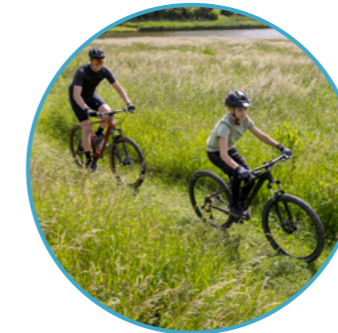
MOUNTAINBIKEROUTE LELYSTAD Nummer 2

Bij het beginpunt is een soort meertje waar je tijdens een warme zomerdag kunt genieten van al het waterplezier.